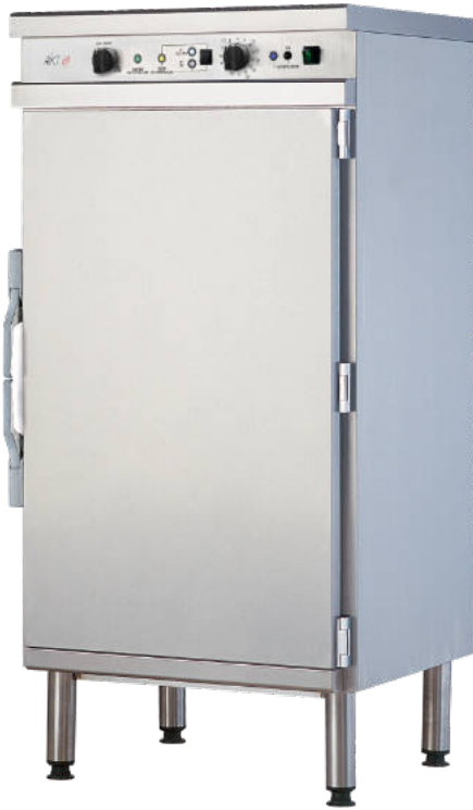
CFE 714 RT

Four de remise en température 11 ou 14 niveaux GN 1/1 ou 16 niveaux GN 1/2. Capacité: de 42 à 160 repas. Habillage et moufle intérieur en acier inoxydable. Minuterie 120 mn. Programme frites et bacs inox intégrés. Thermostat multipoints. Thermostat de sécurité. Oura d'évacuation. Dotation du casier pour barquettes ou bacs inox à définir à la commande. Support de four intégré. Puissance des éléments chauffants: 12,9 kW. Alimentation: 400 V 3N~50 Hz . Four 714 RT avec tableau de commande et régulation électromécanique.