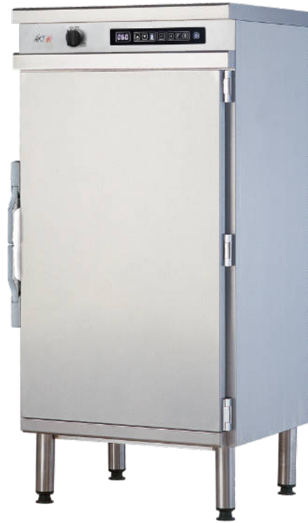
CFX 714 RT

Four 714 RT avec tableau de commande et régulation électronique. Programme "humidificateur" intégré.