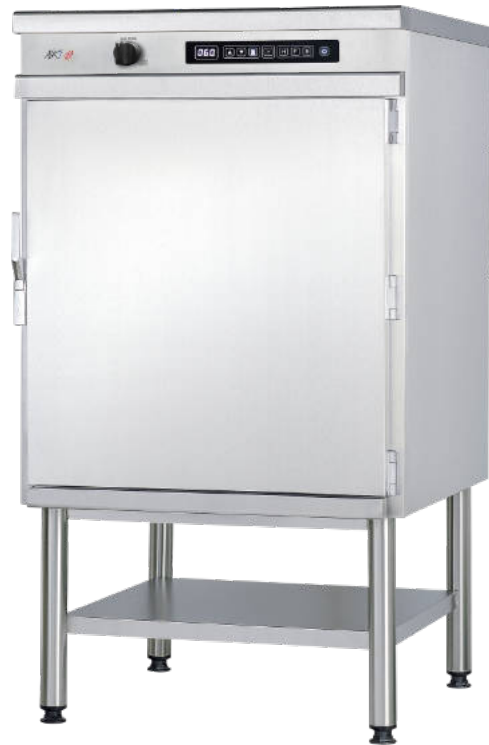
CFX 720 RT

Four 720 RT avec tableau de commande et régulation électronique.